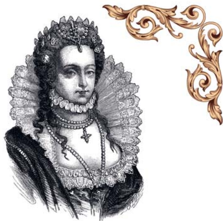
Queen Elizabeth I.

„Lord of Misrule“, eine Art Hofnarr auf Zeit, der sich alles erlauben und auch dem König Kommandos geben konnte. Dabei empfahl sich aber Fingerspitzengefühl ... Auch bei den einfachen Leuten wurden Lords of Misrule gewählt; die Scherze wurden über die Zeit immer derber und weinseliger, so dass Heinrichs Tochter Elizabeth I. diesen Brauch später verbot.