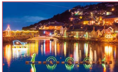
5 | Die Hafenlichter von Mousehole.