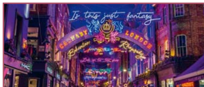
3 | Bunt und flippig: Carnaby Street.

Aus den bescheidenen Anfängen hat sich eine eigene Kunstform entwickelt, die von Profi-Agenturen entwickelt und installiert wird; die Kosten teilen sich meist die Händler. Aus Umwelt-, aber auch Imagegründen werden fast nur noch stromsparende Lämpchen verwendet. In London sind die Dekorationen in den Hauptgeschäftsstraßen eher der Typ „klassisch“ (letztes Jahr mit dem Motto „Heroes“, dabei wurden Namen von Alltagsheldinnen und -helden im Coronazeitalter in Licht geschrieben). Die Carnaby Street versucht ihr hippe Sixties-Flair zu kultivieren und leuchtet knallbunt. Unsere Favoriten sind die Dekorationen von Covent Garden und die bescheidene, aber stimmungsvolle Beleuchtung im Stadtteil Seven Dials mit seinen kleinen Läden und Lokalen. Eine besondere Erwähnung verdient das Dorf Mousehole (gesprochen: Mausel) in Cornwall, das jeweils im Dezember die Häuserfront am Hafen bunt dekoriert und auch das Hafenbecken mit Lichtskulpturen verschönert und dafür kilometerweise Kabel verlegt. Ein Team Ehrenamtlicher übernimmt die Arbeit. 2020 mussten die „Harbour Lights“ zum Kummer nicht nur der Einheimischen ausfallen, dieses Jahr sollen sie – hoffentlich – wieder erstrahlen.