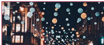
4 | Strahlend schön: Oxford Street.