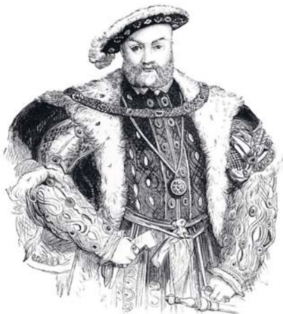
King Henry VIII.