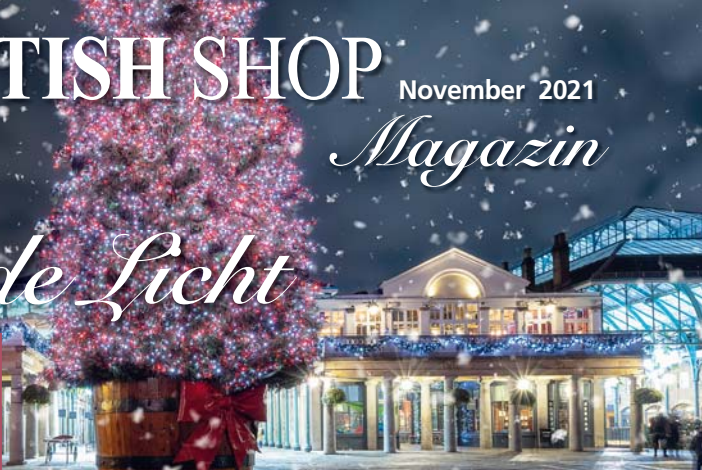
1 | Covent Garden im Festkleid.